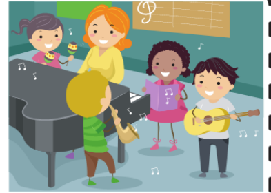
Classe de musique