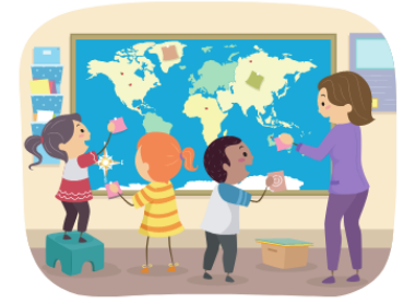
Classe de _____