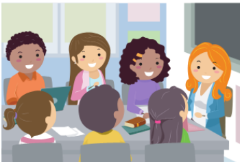
Salon du personnel