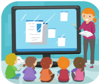
Classe de _____