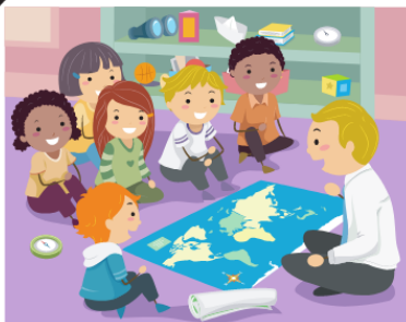
Classe de _____